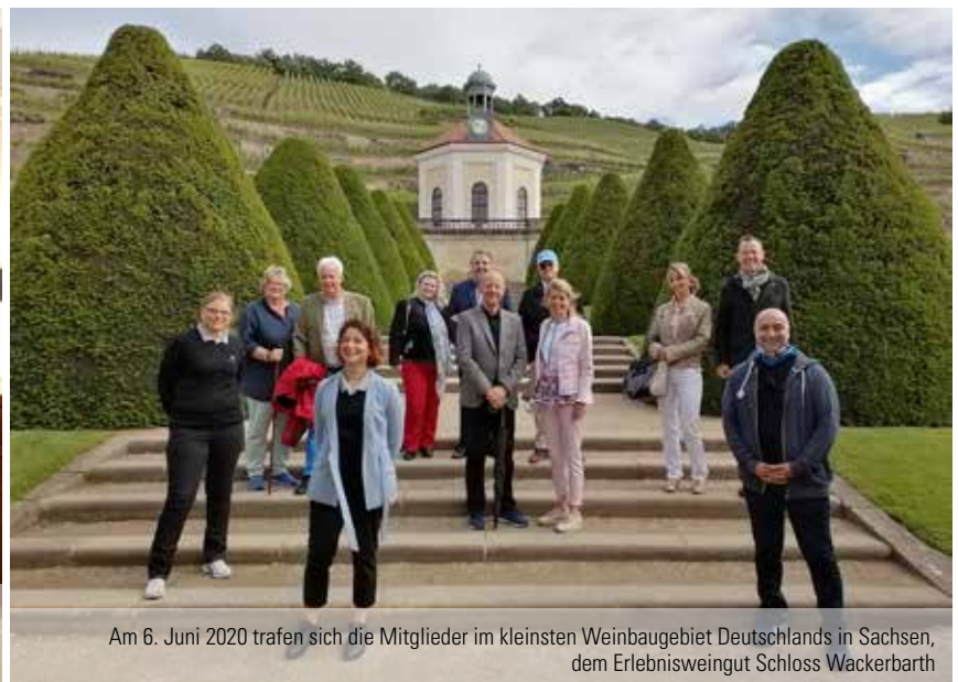
Am 6. Juni 2020 trafen sich die Mitglieder im kleinsten Weinbaugebiet Deutschlands in Sachsen, dem Erlebnisweingut Schloss Wackerbarth