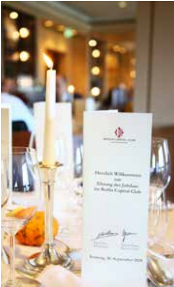
Jubiläumslunch am 20. September 2020