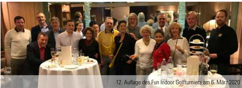
12. Auflage des Fun Indoor Golfturniers am 6. März 2020