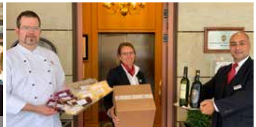
Die »WEIHNACHTSFEIER@home«-Pakete des Clubs