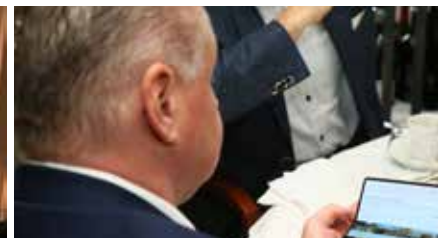
Vorstellung des Samsung Galaxy Z Fold 2 am 18. September 2020